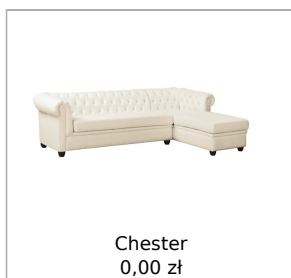
Chester 0,00 zł